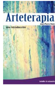
Educación artística Arteterapia Jean-Pierre Klein